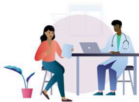
Regularne badania przesiewowe w kierunku HPV oraz odpowiednie leczenie