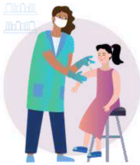
Szczepienia nastolatków przeciw HPV

W celu ochrony kobiet przed niszczącymi skutkami raka szyjki macicy WHO apeluje o: